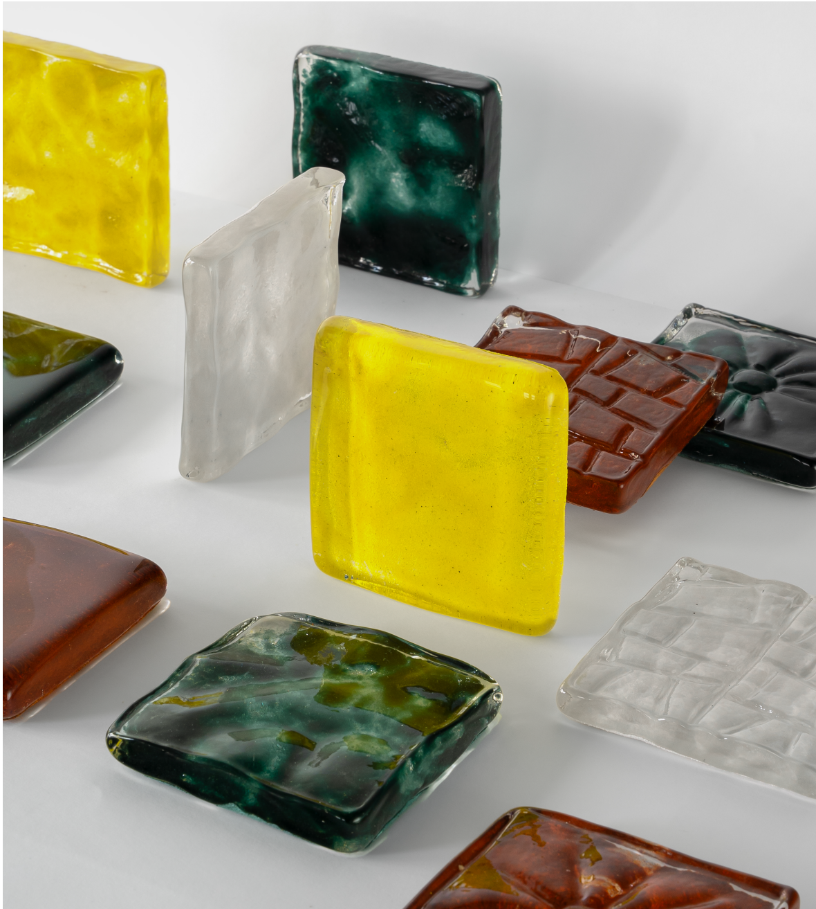
Concelto